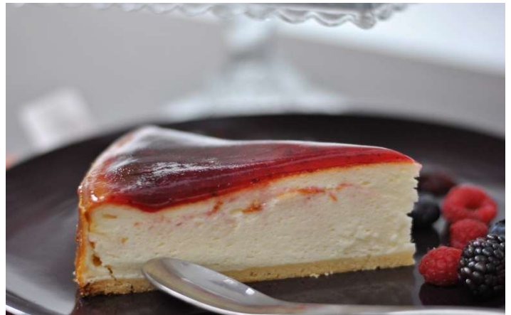
QUESO FRUTAS DEL BOSQUE (QF)