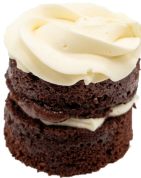
RED VELVET (SGR)