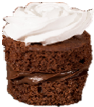
SELVA NEGRA (SGS)