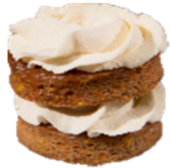
CARROT CAKE (SGZ)