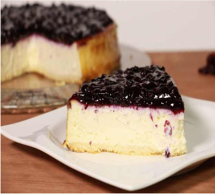
QUESO ARÁNDANOS (QA)